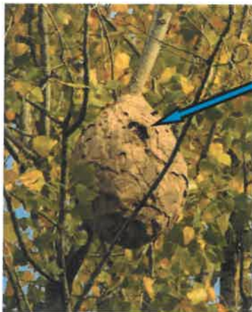
Trou d'entrée du nid sur le côté