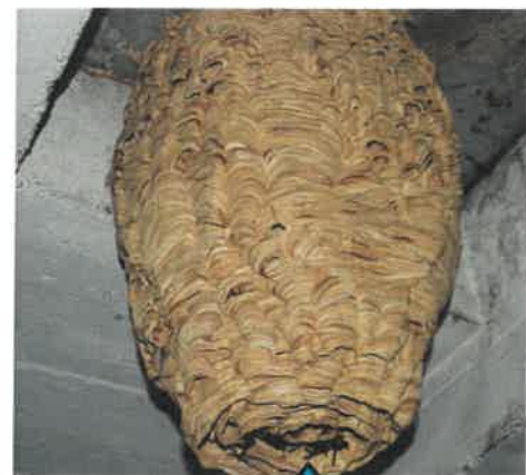
Trou d'entrée du nid au dessous